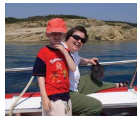
Elsőként mikor tapasztalta meg a Kristálykrém hatását?